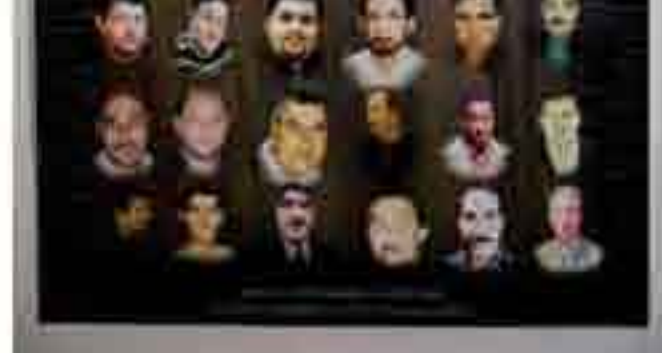
صفحه سوم بعدی