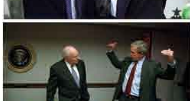
صفحه اول بعدی