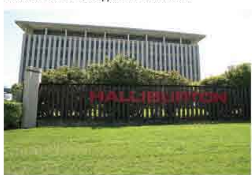
Page 1 Next

Halliburton Overcharges Classified by the Pentagon as Unreasonable and Unsupported - $1.4 billion