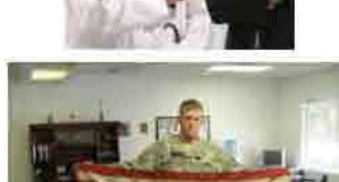
صفحه دوم بعدی

اخصاص ۳.۲ میلیارد دلار برای شرکت KBR که از شرکت‌های تابعه ی هالی برتون، این شرکت پیمانکار ارتش آمریکا برای تأمین مواد غذایی، سوخت، مسکن و اقلام دیگر است.