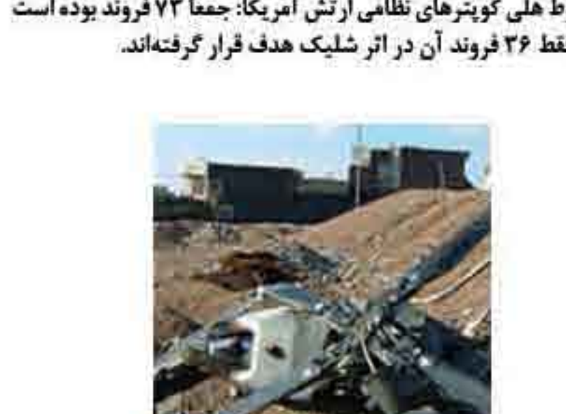
صفحه دوم بعدی

سقوط هلی کوپترهای نظامی ارتش آمریکا: جمعاً ۷۳ فروند بوده است که فقط ۳۶ فروند آن در اثر شلیک هدف فرار گرفته‌اند.